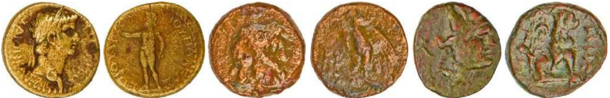
Ç.:19.5X18 mm, E.: 2.5 mm, A.:4.80 gr. Ç.:16.5X17 mm, E.: 3.8mm, A.:5.27 gr. Ç.:16.5X15 mm, E.: 2.5 mm, A.:3.93 gr.