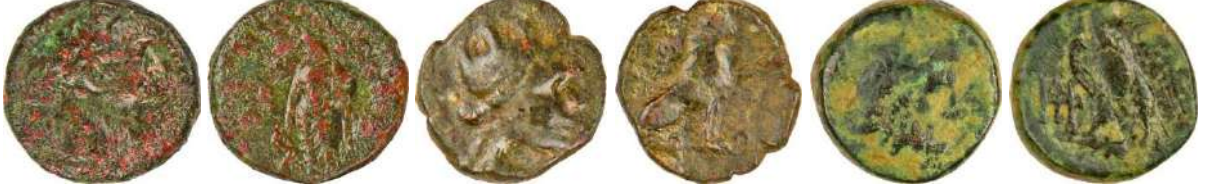
Ç.:18.8X18.5 mm, E.: 2.5 mm, A.:5.53 gr. Ç.:16 mm, E.: 2.5mm, A.:3.29 gr. Ç.:17.5 mm, E.: 3.8 mm, A.:7.75 gr.