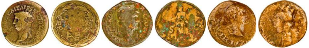
Ç.:23X22.5 mm, E.: 2.5 mm, A.:6.74 gr. Ç.:27X25 mm, E.: 2 mm, A.:10.35 gr. Ç.:17 mm, E.: 3.5 mm, A.:5.40 gr.