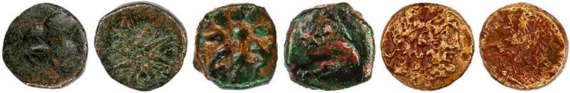
Ç.:18X17.5 mm, E.: 2.8 mm, A.:5.43 gr. Ç.:15X14.5 mm, E.: 2.2 mm, A.:4.16 gr. Ç.:18.5X17.5 mm, E.: 3 mm, A.:7.06 gr.