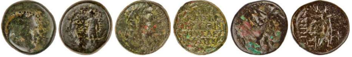
Ç.:16X15 mm, E.: 3.5 mm, A.:5.47 gr. Ç.:17.8X17 mm, E.: 3 mm, A.:6.15 gr. Ç.:17X16 mm, E.: 2 mm, A.:4.03 gr.