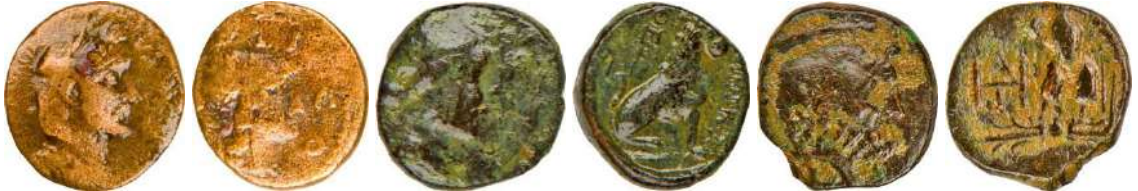
Ç.:18.5X17 mm, E.: 2.5 mm, A.:4.53 gr. Ç.:17X16 mm, E.: 3 mm, A.:4.97 gr. Ç.:17.5X17 mm, E.: 2.1 mm, A.:3.63 gr.