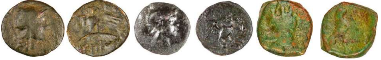
Ç.:16X14.5 mm, E.: 1.5 mm, A.:2.07 gr. Ç.:13.2X13 mm, E.:1.5 mm, A.:1.62 gr. Ç.:17X16.5 mm, E.: 2.8 mm, A.:3.82 gr.