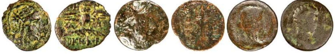
Ç.:15X13 mm, E.:1.1 mm, A.:1.32 gr. Ç.:22X21 mm, E.:2 mm, A.:5.74 gr. Ç.:30X29 mm, E.:3.5 mm, A.:18.91 gr.

arasından seçim yapılarak sikke sayısını sınırlama yoluna gidilmiştir. 73 sikke örneği diğerlerine oranla bazı farklı özelliklere sahip oldukları için seçilerek nümismatik perspektifi açısından değerlendirmesi yapılmıştır.