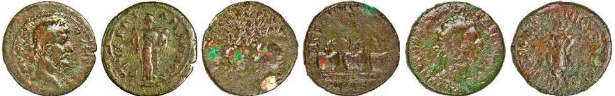
Ç.:27.5X26.5 mm, E.: 3 mm, A.:13.62 gr. Ç.:23.5X23 mm, E.: 2.5mm, A.:7.91gr. Ç.:26.5X25 mm, E.: 3.5 mm, A.:13.9 gr.