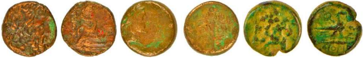
Ç.:19.5 mm, E.: 4 mm, A.:7.88 gr. Ç.:14 mm, E.: 4 mm, A.:4.19 gr. Ç.:19.5 mm, E.: 4.2 mm, A.:7.95 gr.