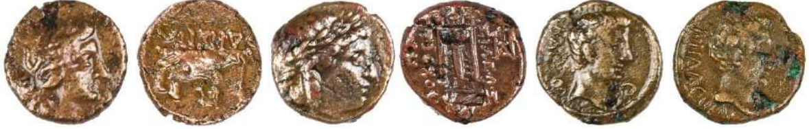
Ç.:17X16.5 mm, E.:3.2 mm, A.:4.35 gr. Ç.:16X15.5 mm, E.: 3 mm, A.:4.37 gr. Ç.:18.5X17.5 mm, E.: 2.5 mm, A.:3.87 gr.