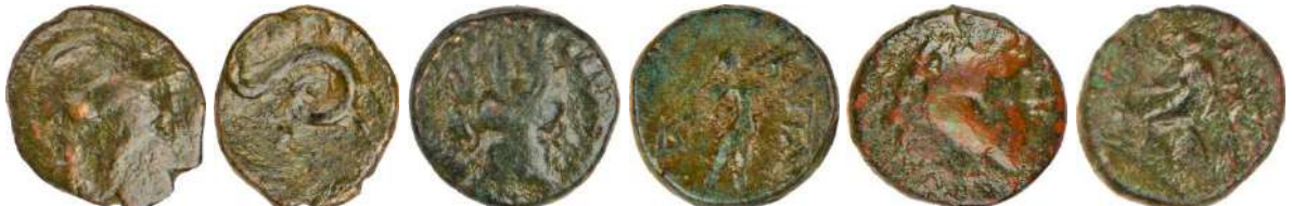
Ç.:14.5X13 mm, E.: 2.2 mm, A.:2.12 gr. Ç.:14.5X14 mm, E.: 3.2 mm, A.:3.85 gr. Ç.:17X15.5 mm, E.: 3 mm, A.:4.45 gr.