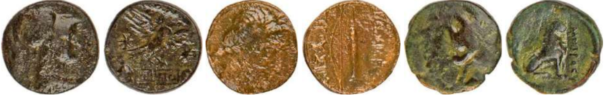
Ç.:19.5 mm, E.: 3 mm, A.:6.45 gr. Ç.:17X16.5 mm, E.: 2 mm, A.:3.84 gr. Ç.:17.5X17 mm, E.: 3mm, A.:4.68 gr.