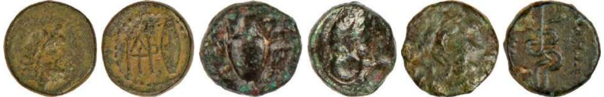
Ç.:15.5 mm, E.: 3mm, A.:4.69 gr. Ç.:0.9X0.9.5 mm, E.: 3 mm, A.:1.43 gr. Ç.:14.5X14.2 mm, E.: 2.5 mm, A.:3.55 gr.