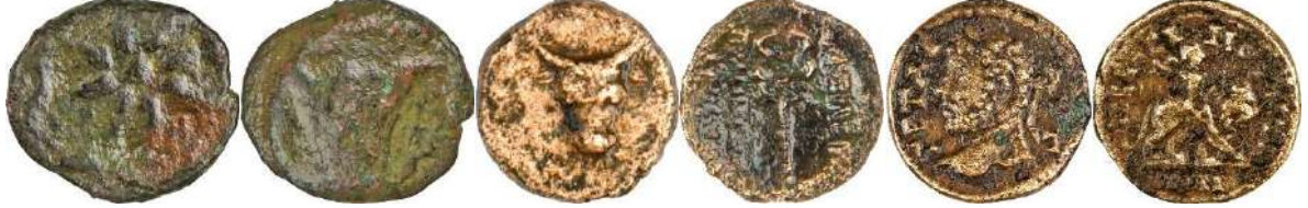
Ç.:18.5X16.5 mm, E.: 2.5 mm, A.:3.89 gr. Ç.:16 mm, E.: 2.5 mm, A.:3.41 gr. Ç.:19.5X19.2 mm, E.: 2mm, A.:4.74 gr.