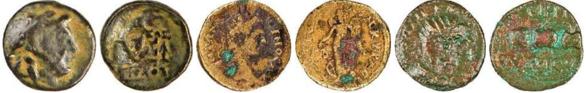
Ç.:16.5X16 mm, E.: 2.5 mm, A.:3.75 gr. Ç.:23.5X24 mm, E.: 2 mm, A.:7.34 gr. Ç.:24.5X23 mm, E.: 2 mm, A.:7.52 gr.