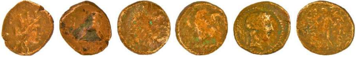
Ç.:18X16.5 mm, E.: 2.5 mm, A.:3.96 gr. Ç.:18.5 mm, E.: 4 mm, A.:6.50 gr. Ç.:18.5X18 mm, E.: 3 mm, A.: 4.56 gr.