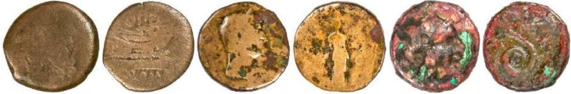
Ç.:30.5X29 mm, E.:3 mm, A.:17.19 gr. Ç.:30X29.5 mm, E.:3.8 mm, A.:22.57 gr. Ç.:14.6X14.5 mm, E.:2.1 mm, A.:2.90 gr.