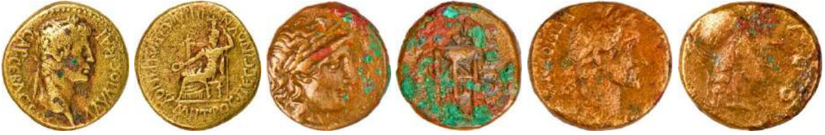
Ç.:20X19.5 mm, E.: 2.5 mm, A.:5.04 gr. Ç.:16.5 mm, E.: 3 mm, A.:4.23 gr. Ç.:17X15.5 mm, E.: 2.5 mm, A.:4.16 gr.