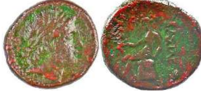
Ç.:25X22.5 mm, E.: 3.5 mm, A.:11.87 gr.

Tebliğimizde sunulacak olan sikkeler arasında oldukça nadir örnekler mevcut olup, ilk kez bu sempozyumda sunulacaktır.