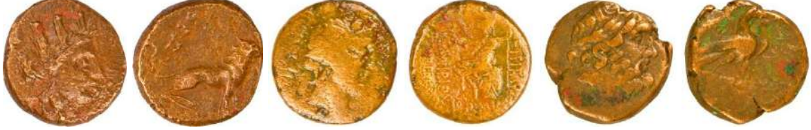
Ç.:14.5X14 mm, E. 3 mm, A.:3.64 gr. Ç.:22X21.5 mm, E.:2.8 mm, A.:7.95 gr. Ç.:19 mm, E.: 4.5 mm, A.: 6.84 gr.