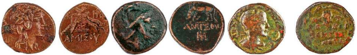
Ç.:22.8 mm, E.: 2.5 mm, A.:8.40 gr. Ç.:23.5 mm, E.: 3.5 mm, A.:12.49 gr. Ç.:26X24 mm, E.: 1.5 mm, A.:9.68 gr.