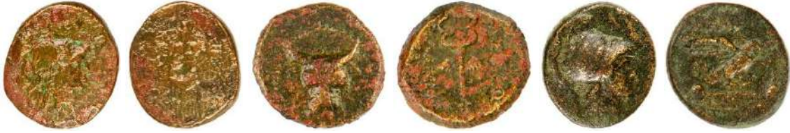
Ç.:21X18.5 mm, E.: 3.5 mm, A.:6.11gr. Ç.:18X17 mm, E.: 2.8 mm. A.: 3.89gr. Ç.:22.5X20 mm, E.: 3 mm, A.:7.62 gr.