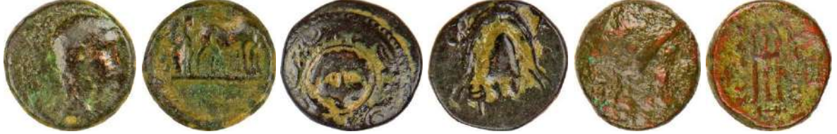
Ç.:15.5X16.8 mm, E.: 2.1 mm, A.:4.06 gr. Ç.:15.5X15 mm, E.: 3 mm, A.:3.36 gr. Ç.:16X15.5 mm, E.: 3.5 mm, A.:4.92 gr.