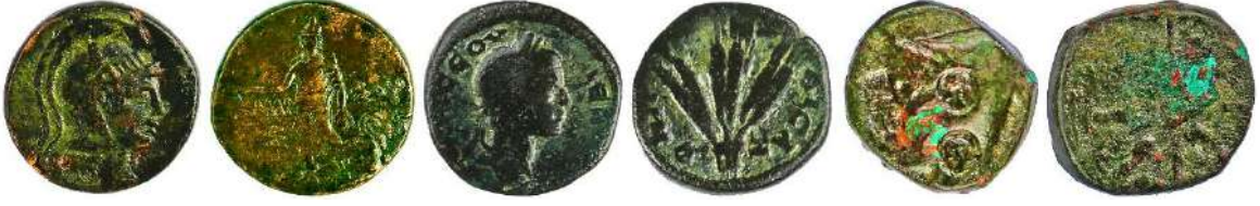
Ç.:29.2X28.5 mm, E.: 3 mm, A.:19.14 gr. Ç.:19 mm, E.: 2 mm, A.:5.56 gr. Ç.:26X25.8 mm, E.: 3.8 mm, A.:20.37 gr.